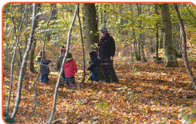
Les élèves de l'implantation de Vierset